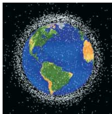
European Space Agency ESA_ESOC

La basura espacial es un problema cada vez más delicado. Una cantidad desconocida, pero sin duda creciente de chatarra envuelve la Tierra, amenazando a los satélites operativos y a los astronautas.