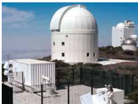
OGS Estación óptica terrestre

http://www.newscientist.com/article.ns?id=dn6153