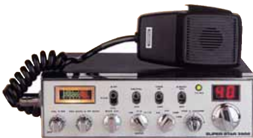
En la parte superior, de izquierda a derecha, los equipos Alinco DJ-X3E y ADI AF-16. Arriba, el Super Star 3900.