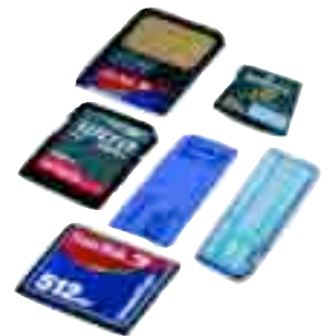
Existen posibilidades de que las tarjetas de memoria en cámaras digitales, también puedan ser gravadas

A juicio del director general de ASIMELEC, “a tenor de estas cifras, las propuestas de las Entidades de Gestión cabe considerarlas desorbitadas, ya que parece que mediante el canon por copia privada se pretendiera también paliar los efectos de la piratería, un fenómeno ajeno a la industria y a los usuarios sobre los que no se puede cargar este perjuicio”.