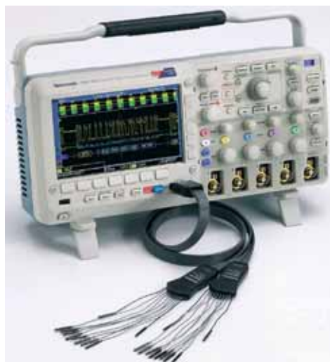
Osciloscopios de señales mixtas de la serie MSO2000.

La serie MSO2000 con entradas analógicas/digitales y la serie DPO2000 con entradas analógicas destacan por su riqueza de prestaciones, facilidad de uso y portabilidad.