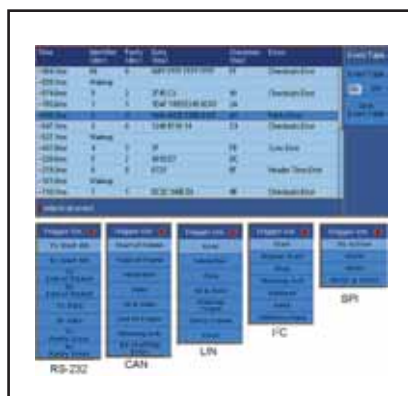
Figura 2.- Disparos y descodificación de buses serie. Tabla de mensajes descodificados.

“Los diseñadores necesitan herramientas potentes y fáciles de utilizar para la depuración tanto de señales analógicas como digitales y con diferentes gamas de precios”, dijo Bob Bluhm, vicepresidente de la línea de productos “Value” de Tektronix. “Las series MSO2000 y DPO2000 proporcionan excelentes prestaciones, gran capacidad de depuración de datos en serie de los estándares de buses más comunes y una magnífica relación calidad/precio. Son parte de la plataforma de nueva generación que incluye a las series DPO3000, DPO4000 y MSO4000, proporcionando a los ingenieros una continuidad de opciones de selección desde 100 MHz a 1 GHz. Los nuevos modelos ofrecen un manejo intuitivo, medidas fiables, portabilidad y son ideales para los ingenieros que desean probar de manera más eficiente sus diseños.”