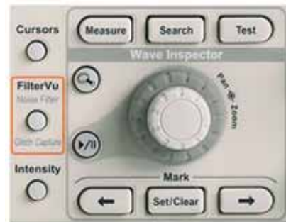
Figura 4.- WaveInspectorTM para la búsqueda y marcado automático de eventos y navegación entre las marcas.

Los osciloscopios de las series MSO2000 y DPO2000 incluyen el innovador motor de búsqueda Wave InspectorTM en todos los canales analógicos y digitales, un conjunto sin precedentes de herramientas fáciles de usar que hacen más simple y eficaz la labor de búsqueda de eventos de interés a largo de la memoria de registro. Wave InspectorTM ofrece también la posibilidad de búsqueda automática a través de una adquisición y marca todas las ocurrencias de un evento determinado por el usuario para luego navegar sin esfuerzo entre las marcas. Con la navegación hecha posible por Wave InspectorTM, las series MSO2000 y DPO2000 ayudan a los ingenieros a encontrar con rapidez y resolver los problemas difíciles (Figura 4).