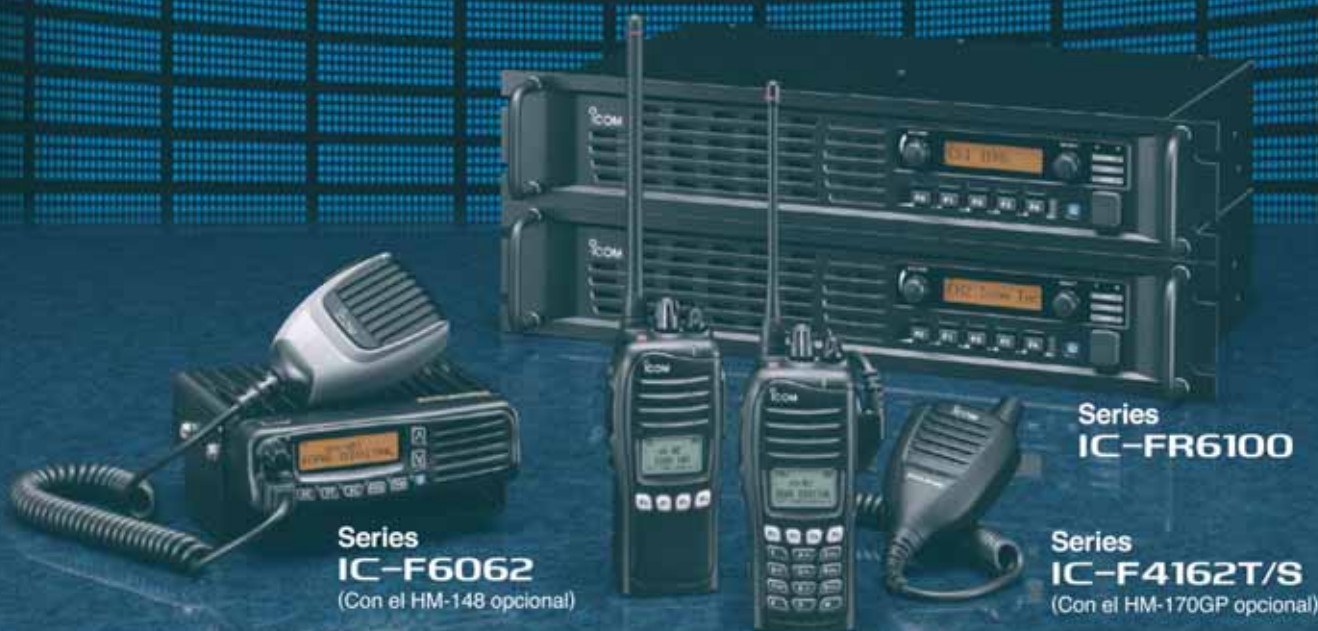
Series IC-F6062 (Con el HM-148 opcional)