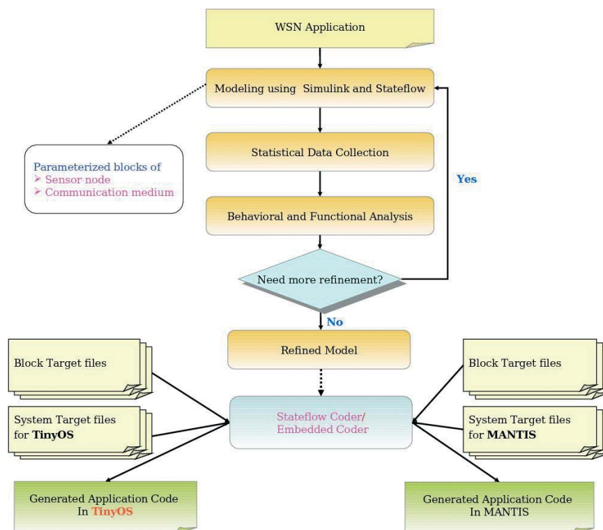
Figura 2: estructura para modelado, simulación y generación de código para aplicaciones de WSN.

Se puede implementar el bloque de medio de comunicación en C, de modo que pueda modificarse para reutilizar los modelos de canal y conectividad existentes. Ahora estamos trabajando, por ejemplo, en refinarlo usando los estándares físicos de ZigBee y Medium Access Control.